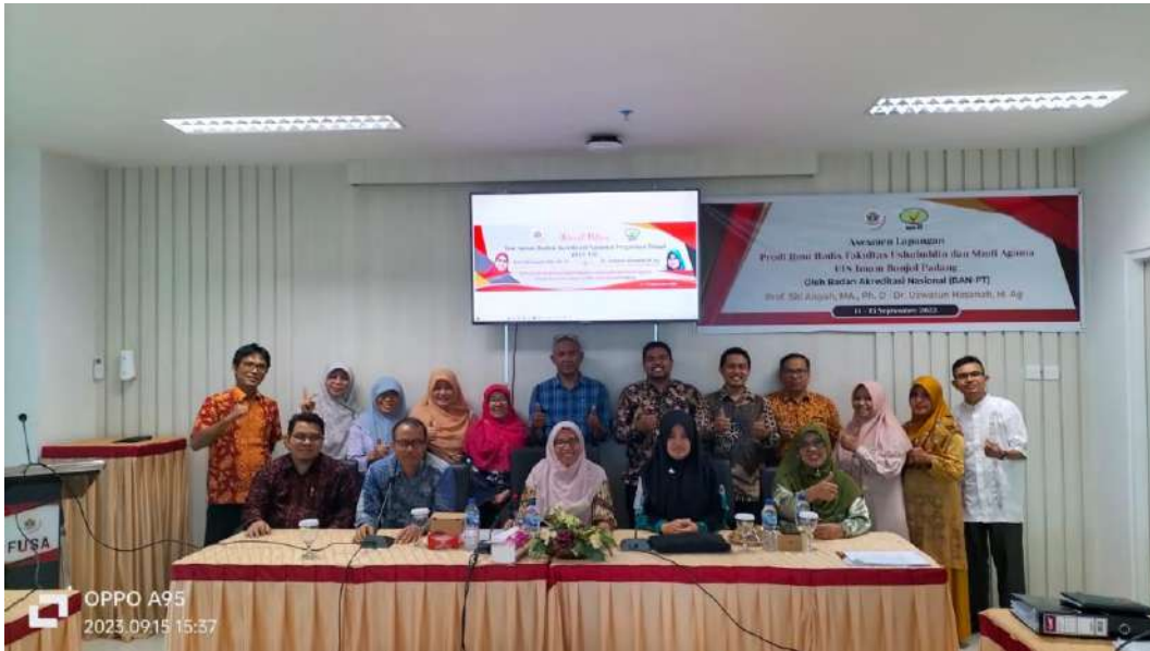
OPPO A95 2023.09.15 15:37